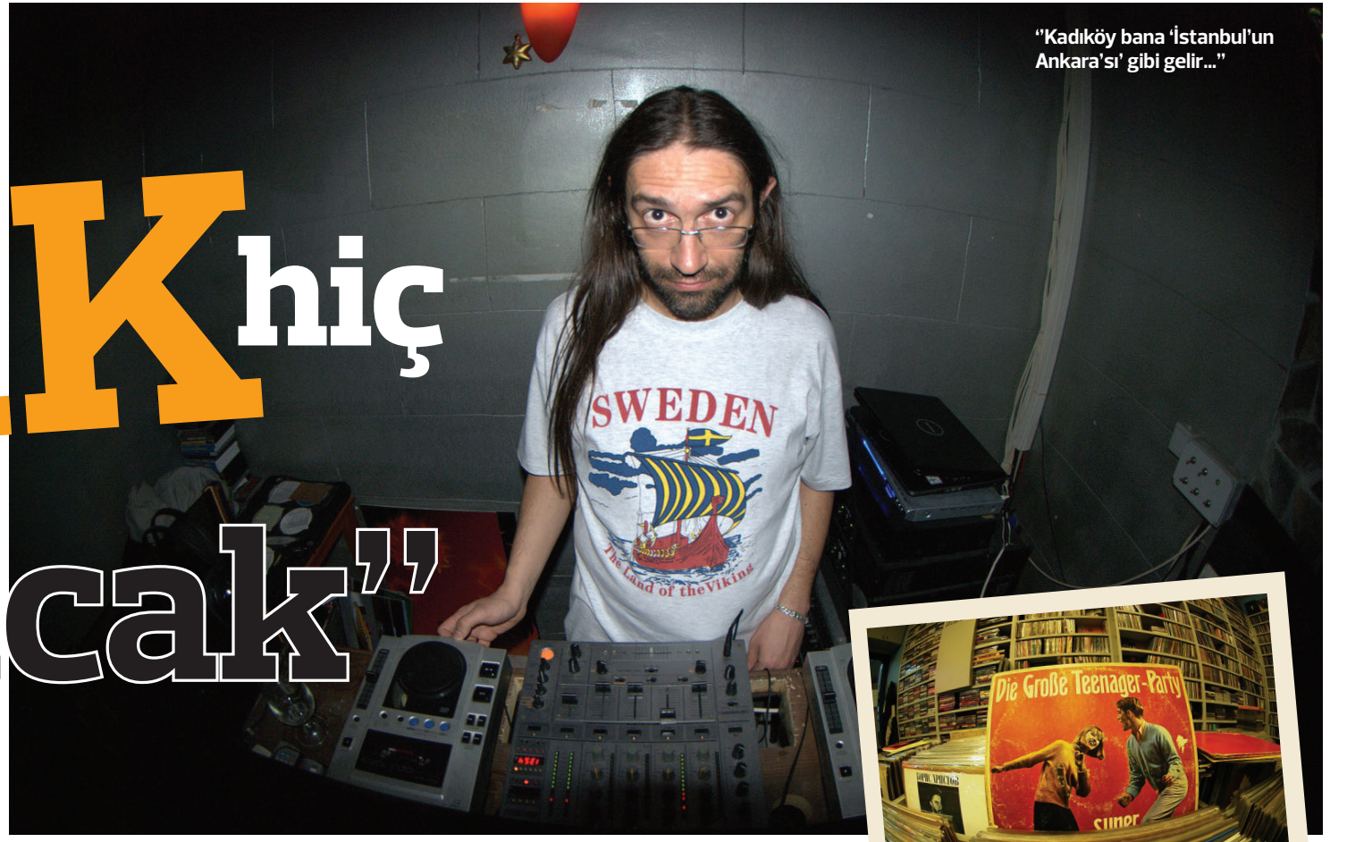
"Kadıköy bana 'İstanbul'un Ankara'sı' gibi gelir..."