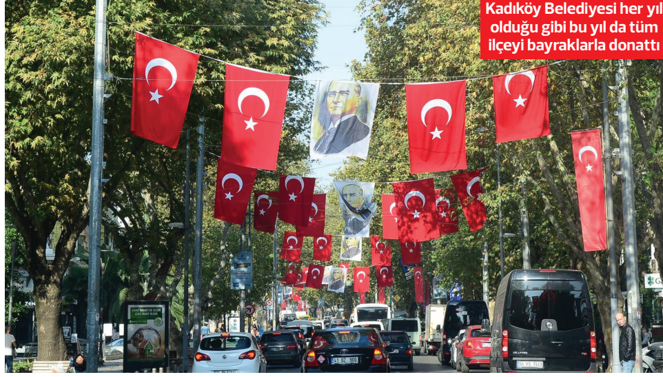
Kadıköy Belediyesi her yıl olduğu gibi bu yıl da tüm ilçeyi bayraklarla donattı

si'nde Kadıköy Belediyesi'nin tertip ettiği yürüyüşlere İstanbul'da olduğumda hemen hemen her yıl katılıyorum.