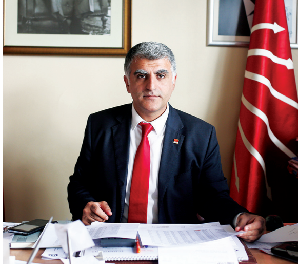
CHP: "SEÇMEN KAYDI DÜŞÜRÜLMEDİ"

Gazete Kadıköy'e konuşan CHP, HDP ve MHP Kadıköy İlçe Başkanları da Kadıköy'deki seçmen sayısının düşmesinin kentsel dönüşümden kaynaklandığını belirtti. AKP Kadıköy İlçe Başkanlığı ise talebimize yanıt vermedi.