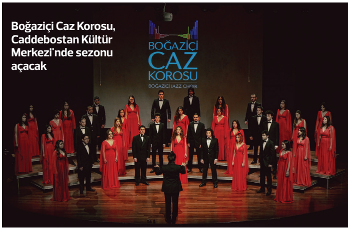
Boğaziçi Caz Korusu, Caddebostan Kültür Merkezi'nde sezonu açacak